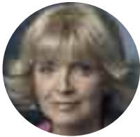
Barbara Sommer Ministerin für Schule und Weiterbildung des Landes NRW

„Lesen und Lernen gehören untrennbar zusammen. Wir müssen die Lese- und Entdeckungsfreude der Schülerinnen und Schüler wecken und erhalten. So legen wir die Grundlagen für die Freude an lebenslangem Lernen.“